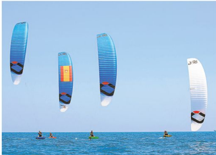
El kiteboard está cogiendo mucho auge en España