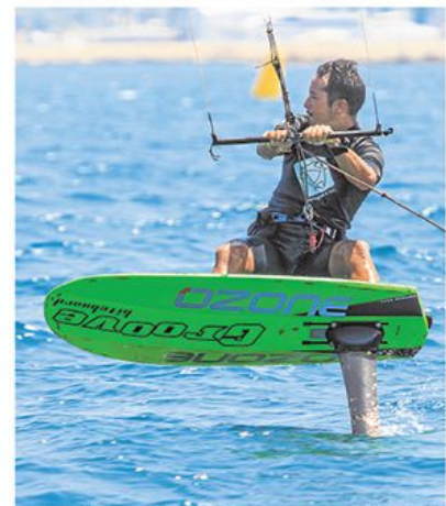
Los «foils» ya imperan también en las tablas

«REFLEXIONA SOBRE LO QUE HAYAS ESCUCHADO» O «ENSEÑA A LOS MÁS JÓVENES» PERO SERÍA FANTÁSTICO LOGRAR CONSEGUIR ALGUNOS PILARES MAESTROS PARA EL MUNDO DEL MAR